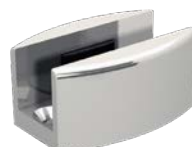
przewodnik dolny do drzwi szklanych