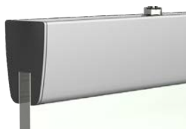
przewodnica do drzwi szklanych