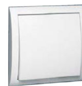
C0001290 przełącznik z przyciskiem