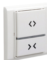
C0004780 wyłącznik beprzewodowy